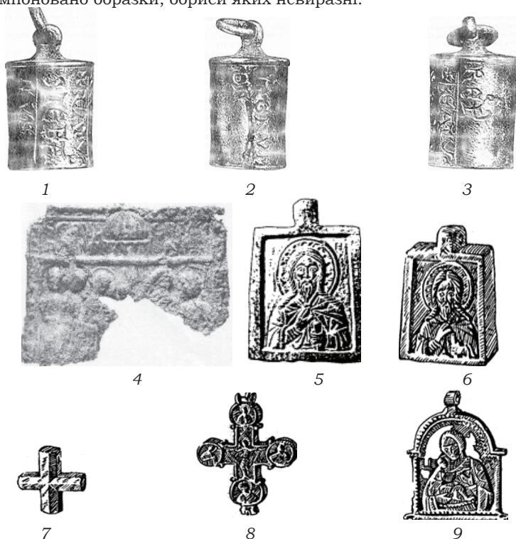
Рис. 1. Християнські реліквії з розкопок давньоруського городища біля м. Шепетівки: релікварій з запаяними мощами первомученика Св. Степана і Древа Хреста Господнього – 1, 2, 3; пластина з зображенням Гробу Господнього – 4; іконки – 5, 6, 9; натільний хрестик – 7; енколпійон – 8.

нів та на кінці вертикальної перекладки, внизу, наявні напівкруглі виступи з отвором посередині. Висота виробу 6,2 см., ширина 4,2 см. З лицьової сторони художник помістив зображення Богоматері з малюнком на лівій руці, а на зворотній – розп'яття Христа. У медальйонах скомпоновано образки, обриси яких невиразні.