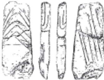
Рис. 2. Антропоморфна стелла з урочища Новина с. Мишків – знахідка 1981 р.

Так, восени 1999 р. Південно-Тернопільська археологічна експедиція Заліщицького краєзнавчого музею здійснила розвідку в с. Мишків, де на присадибній ділянці одного із жителів села зберігався фрагмент ідола (рис. 2). Як з'ясувалося, цю антропоморфну стелу було знайдено у 1981 р. на орному полі урочища Новина недалеко від джерела Скала.